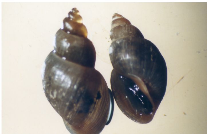
شکل ۳- لیمنه ترونکاتولا ناقل فاسیولا‌هپاتیکا

انواع حلزون‌های جنس لیمنه ناقلین مهم انگل‌های فاسیولاهستند. حساسیت حلزون‌های مختلف جنس لیمنه به انگل‌های فاسیولای موجود در ایران به وسیله محققین متعددی مورد بررسی قرار گرفته است. اگرچه این تحقیقات با نتایج متفاوتی همراه بوده است، ولی دیدگاه غالب بیانگر این است که حلزون لیمنه ژدروزیانا ( Lymnaea gedrosiana ) ناقل فاسیولاژیگانیتیکا و حلزون لیمنه ترونکاتولا ( Lymnaea truncatula ) ناقل فاسیولا‌هپاتیکا می‌باشد.