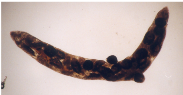
شکل ۵- ردی بالغ فاسیولا

در مدت ۲۴ ساعت خواهد مرد. میراسیدیم پس از نفوذ در بدن حلزون، به یک جسم کیسه‌ای شکل به نام اسپوروسیست (Sporocyst) تغییر شکل می‌یابد. در این اسپوروسیست شکل دیگری از انگل به نام ردی (Redia) به وجود می‌آید (شکل ۵).